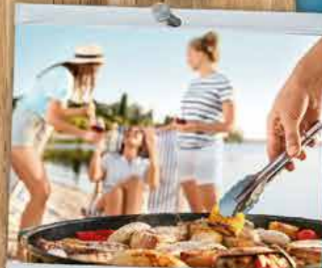
Vier de zomer