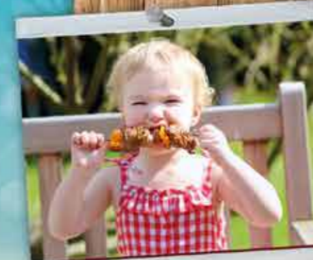
Smullen in de tuin